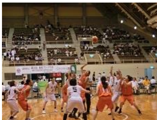
国民体育大会ブロック大会 競技の様子